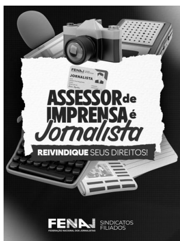
Campanha "Assessor de Imprensa é Jornalista"

Na condição de jornalista como qualquer outro/a, o/a Assessor/a de Imprensa tem os mesmos direitos daqueles/as que atuam nas redações de jornais. O artigo 303 da Consolidação das Leis Trabalhistas (CLT) determina a jornada especial de trabalho dos jornalistas. Já o artigo 304 da CLT prevê a possibilidade de ampliação da carga horária.