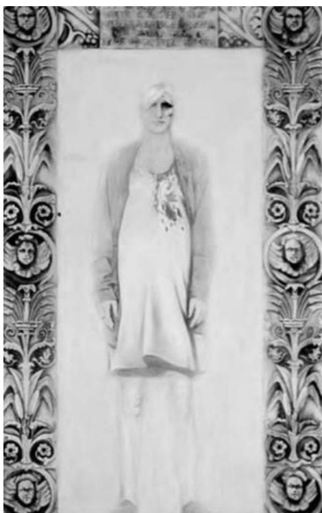
“DLB, grávida de 6 meses foi espancada pelo marido porque o jantar não estava pronto, Itaquaquecetuba, 10/09/1995”

No trabalho da brasileira Dora Longo Bahia, a arte traz a possibilidade de ressignificação da situação de violência doméstica vivida por várias mulheres, quando através de algumas de suas obras a artista pinta a si mesma na situação de mulheres agredidas, acompanhando legendas de fotos que chamam atenção os “motivos” para a agressão, onde detalhes de uma relação íntima são expostos nas páginas policiais e beiram a irrealidade.