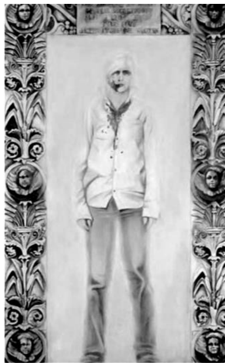
“DLB apanhou do irmão porque arrumou um amante muito jovem para ela, Jardim Baronesa, 04/07/1995”