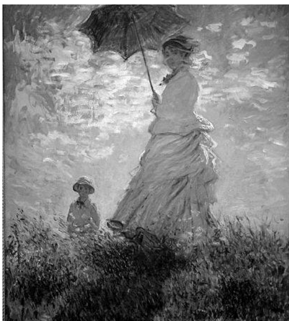
MONET, Mulher com Sombrinha. 1875/ www.historiadasartes.com/sala-dos-professores/almoco-dos-remadores-pierre-auguste-renoir/